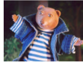
Béber le hamster, le grand expert en graines