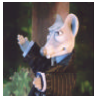
Le grand Patron , l'ambitieux parrain de la graine Big Boum