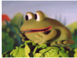
Chouquette la reinette, la star des étangs