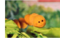
Toto Rapido , l'escargot toxico de salade